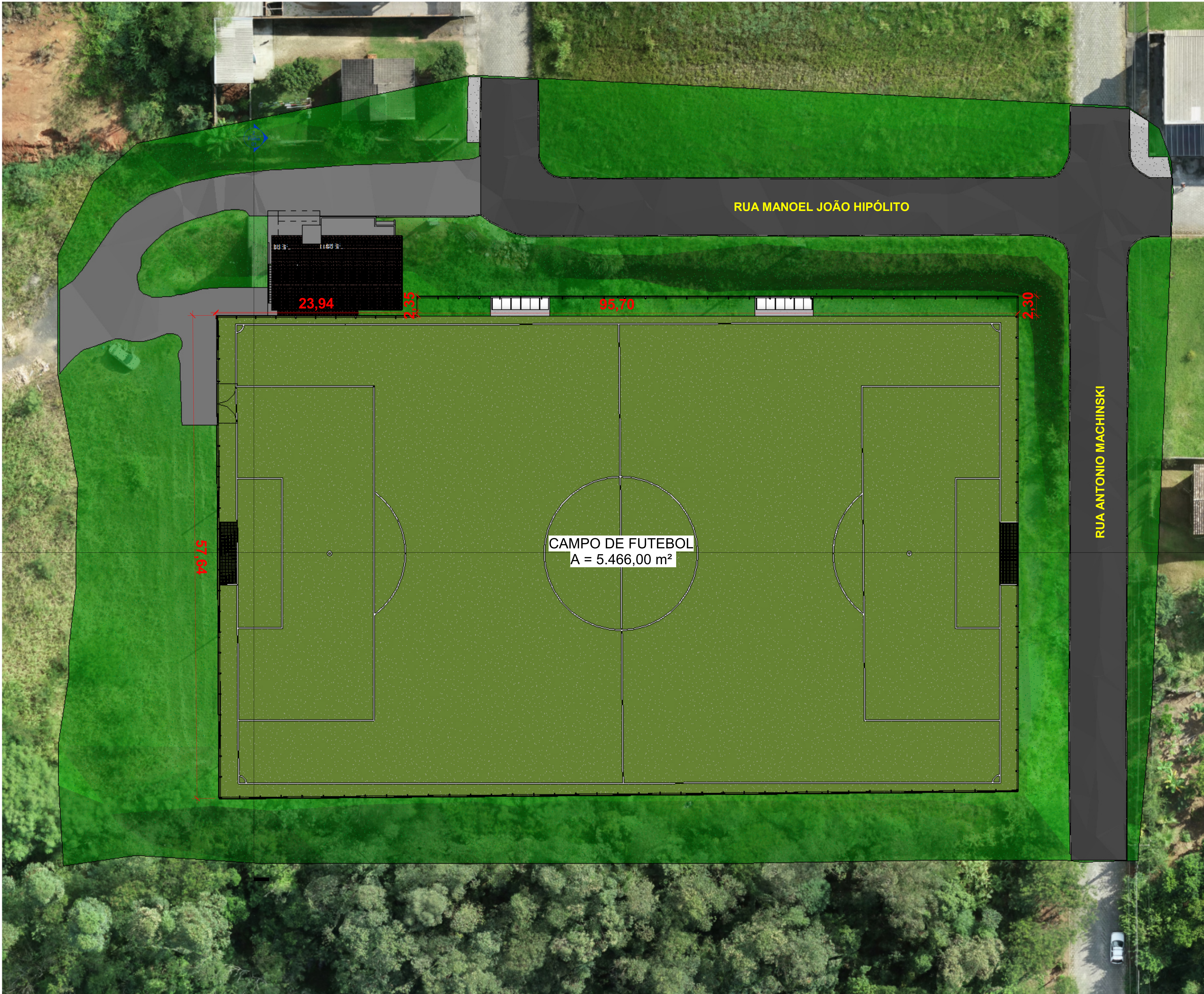
1 Implantação ESCALA: 1:200